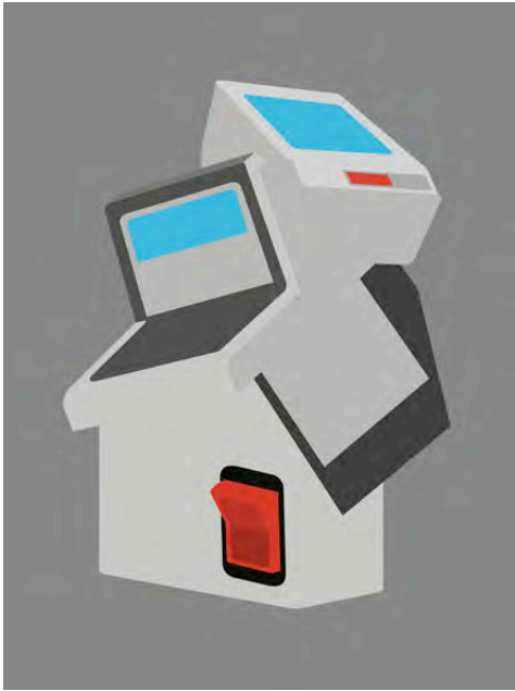
Items, Paul Kirps, 2006

Si le travail du graphiste s'élabore d'ordinaire en deux dimensions, tu réalises une intervention spatiale à Basta. Dès lors, comment appréhendes-tu la tridimensionnalité?